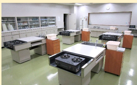
栄養実習室（20人程度）