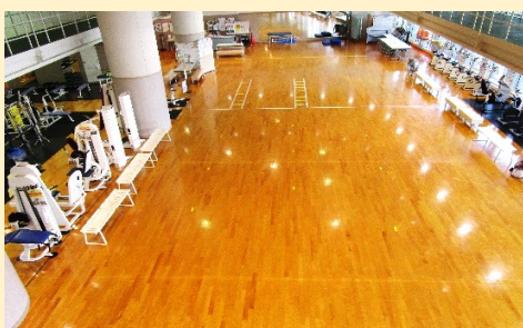
フィットネスホール中央フロア（40人程度）