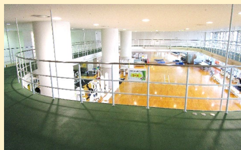
1周70mのウォーキングコース