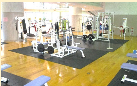
各種マシン・フリーウエイトを備えたトレーニングジム