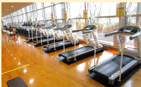
充実した有酸素運動機器