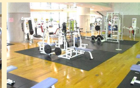
各種マシン・フリーウエイトを備えたトレーニングジム