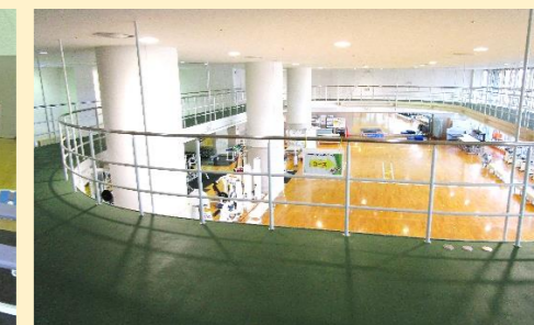
1周70mのウォーキングコース