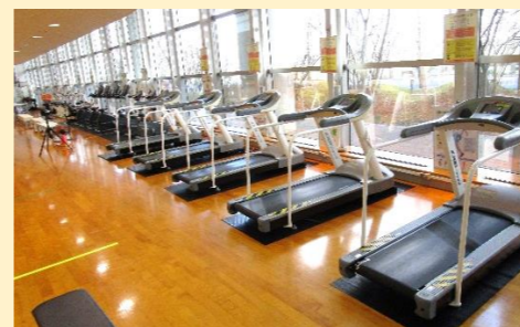
充実した有酸素運動機器