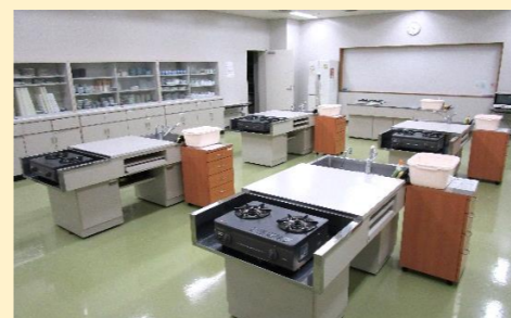
栄養実習室（20人程度）