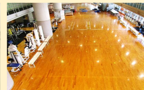
フィットネスホール中央フロア（40人程度）